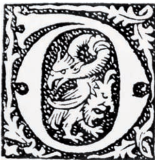
7. FANTASKNÍ BYTOST. Iniciála, Paříž, počátek 16. stol.