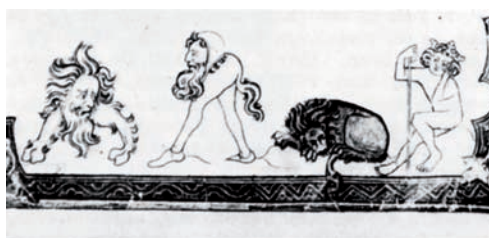
2. HLAVY NA NOHÁCH. Vlevo: Folio, cca 1280, Fitzwilliamovo muzeum, Cambridge. Vpravo: Žaltář z Lambethského paláce, Londýn, počátek 14. stol.