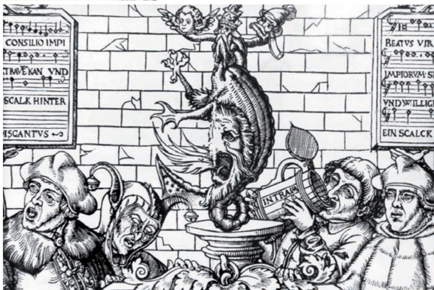
8. OBRAZ PAPEŽSTVÍ. Rytina, Norimberk, 1548.

lově žaltáři (1340) 17 a v rukopise z Cambrai (14. století) 18 je druhá hlava ptačí, jinde psi nebo liščí. 19