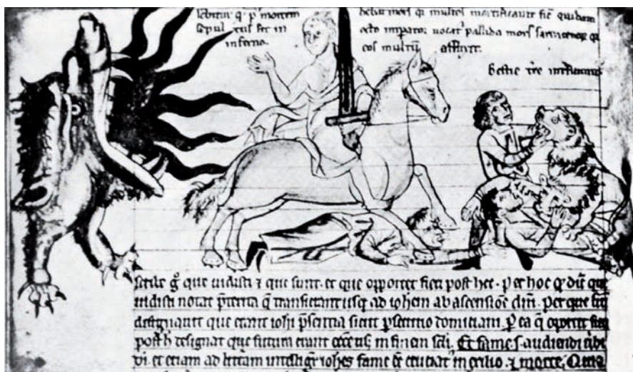
4. HLAVA NA NOHÁCH. Apokalypsa , 14. stol., německý rukopis, Landesbibliothek, Drážďany.

pečeti: hlava Leviatana utíká za Smrtí jedoucí na popelavém koni (obr. 3). Vyobrazení doslova ilustruje příslušný biblický text: