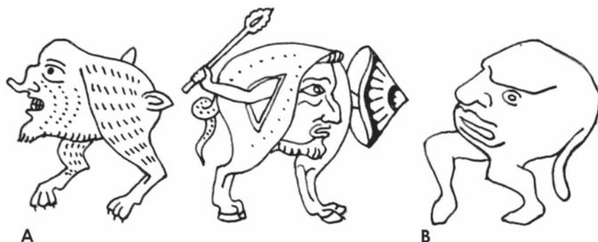
1. HLAVY NA NOHÁCH. A. Strop muzea v Metách, cca 1220. B. Chórové lavice v Lynnu, cca 1415.

ské kosmografii 4 jsem již ukázal, jak do středověkého umění přenesená 5 vyobrazení zvěrokruhu, větrných růžic a helénistických planisfér neustále proměňují svůj obsah. Tato vyobrazení od 13. století opět zažívají obrodu, zaplňují se symbolickými postavami a pronikají do nových oblastí obraznosti. Ke znovuobjevení přispěl významnou měrou islám, ale i samotné křesťanství se v tomto směru začíná probouzet. Vzniká celá řada podivných stvoření, která ve 12. století nebyla známa, nebo jen málo, a která se stávají rozšířeným prvkem gotické obraznosti. Mezi nimi zaujímají přední místo příšery s různými kombinacemi hlav.