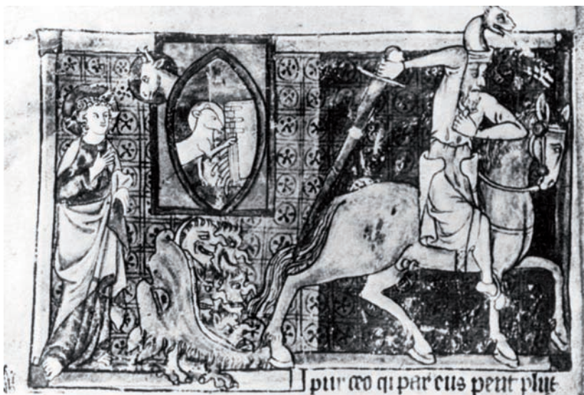
3. HLAVA NA NOHÁCH. Rozlomení čtvrté pečeti, anglonormanská Apokalypsa , Toulouse, počátek 14. stol.

ze hlava s bradkou a dvě zvířecí nohy. Navzdory anatomickým omezením působí tyto příšery neuvěřitelně živým dojmem (obr. 1). Nalezneme je například na podlahové mozaice v kostele sv. Hildeberta v Gournay (14. st.), 7 na reliéfu chórových lavic v Herefordu (1380) 8 a Lynnu (okolo roku 1415). 9 Velmi rozšířené jsou v iluminacích rukopisů. Na foliu z Fitzwilliamova muzea v Cambridge (okolo roku 1280) 10 můžeme vidět hrozivou tvář s bujným vousem a hřívou vlajících vlasů, jak kráčí na nohách jakéhosi čtvernožce. Kopii této kresby nalezneme v Žaltáři z Lambethského paláce (počátek 14. století), 11 který sice pochází z yorské diecéze, ale odráží vliv východoanglického stylu (obr. 2). Ze stejného vzoru vychází i groteska ve spise Waltera de Milemete (1326–1327). 12